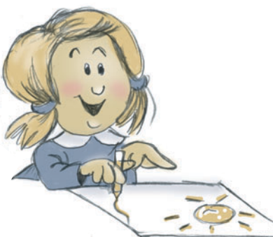
Je colorie sans dépasser les contours des formes