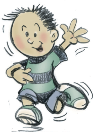
J'agis et je bouge bien

Afin de faciliter leur utilisation par les enfants, ces derniers doivent connaître les compétences qu'ils devront développer au cours de l'année. Ces diverses compétences sont détaillées dans leur bulletin. Chaque compétence est décrite en utilisant le « je » et est illustrée à l'aide d'un pictogramme comme dans l'exemple suivant :